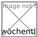
image not found or type unknown Dieses Holz-Kamishibai wurde von der Schülerfirma Stöckchen der Jan-Daniel-Georgens-Schule (Förderschule LE) aus Düsseldorf im Rahmen des wöchentlichen „Schulpraktischen Tages“ der Abschlussstufe gebaut.

Es hat einen Einschub für Bilder in der Größe Din A3. Die Klapptüren sind mit Scharnieren befestigt und lassen sich nach vorne öffnen.